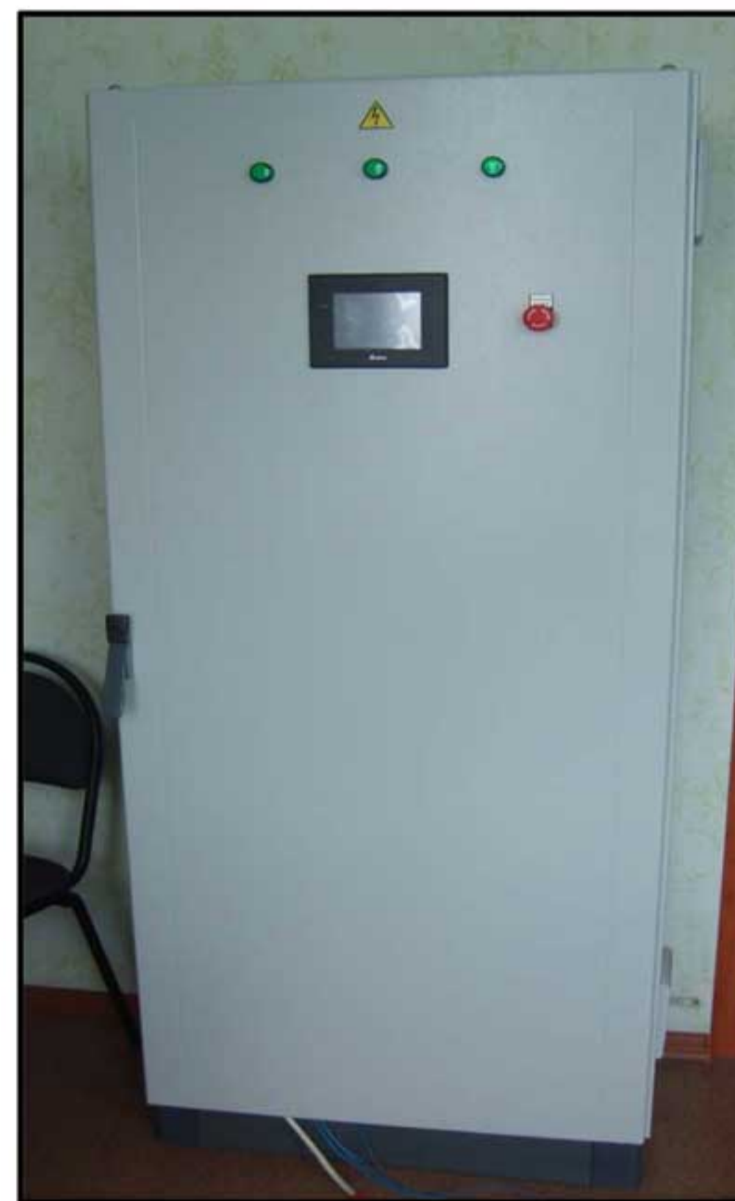
Оборудование Delta внутри шкафа управления