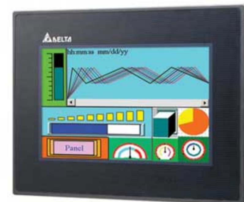
Панель оператора Delta DOP-B