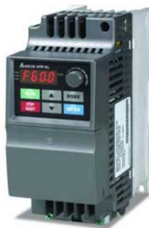
Преобразователь частоты Delta VFD-EL