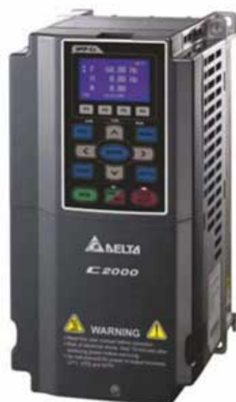
Преобразователь частоты Delta VFD-C