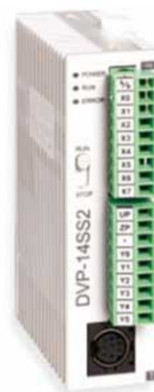
ПЛК Delta DVP-SS2