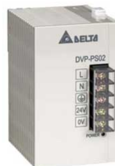
Блок питания Delta DVP-PS02